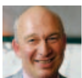
EMMANUEL WART BOURGMESTRE

"Nous ne négligeons aucun détail", raconte le bourgmestre des Bons Villers. "Par exemple, lors des réunions, nous ne distribuons plus de farde épaisse, remplie de papiers. Maintenant, on ne distribue que deux ou trois feuilles. Le reste est envoyé par mail". Prochainement, la commune sera également dotée d'un conseiller en énergie. Le service "Travaux" va aussi recevoir un véhicule électrique. Ainsi que deux brosses de rues mécaniques, pour éviter l'emploi de produits chimiques. "Et l'on continue à se battre contre les dépôts clandestins de déchets", ajoute le mayor.